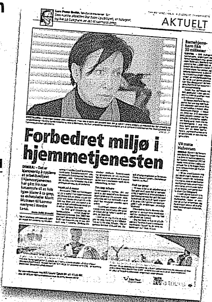
OA 30. DESEMBER 2009