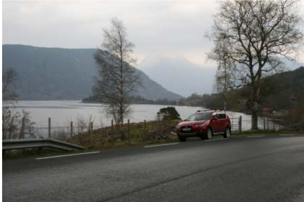
Utsikt mot Rosendalsfjella frå Uskedalen