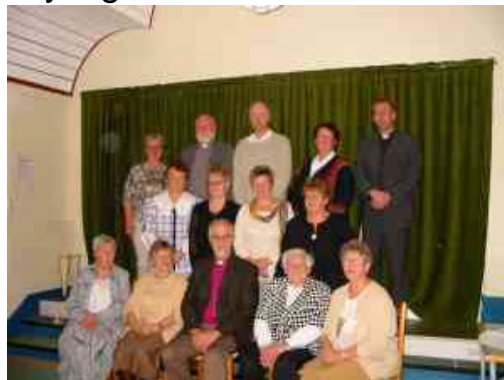
En stor del av kirkeforeningen sammen med biskop, prost, fung. stiftsdirektør og prest under bispevisitasen.

På spørsmål om hvorfor det ofres så mye tid og også penger, kommer svaret enkelt og utvetydig – fordi vi er glade i kirka vår. Denne gleden har blitt en felles glede for menigheten og presten. Gudstjenestene i Gamvik får et spesielt innhold når de følges av orgelmusikk. Orgelet som kirkeforeningen har kjøpt inn er elektronisk. Dette betyr at vi kan ha musikk uten organist. Noe som gjør gudstjenestene mye ”enklere” for presten. Vi må bare slutte oss til visitasmeldingen. – Menigheten er Kirkeforeningen stor takk skyldig.