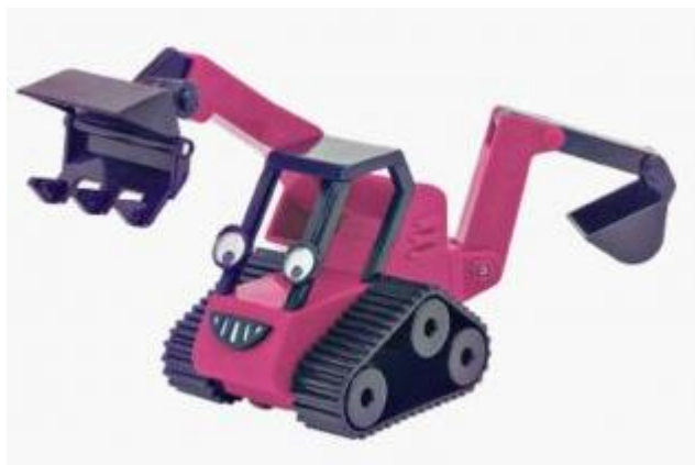
- Behov for fornyng av eksisterande gravemaskin