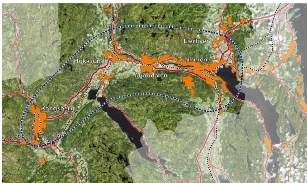
Figur 1: Buskerudbyen omfatter kommunene Lier, Drammen, Nedre Eiker, Øvre Eiker og Kongsberg.

Dette dokumentet er et styringsdokument for prioritering av tiltak innenfor den årlige økonomiske tilskuddsrammen som blir gitt fra Samferdselsdepartementet knyttet til den fireårige avtalen om belønningsordningen for bedre kollektivtransport og mindre bilbruk datert 5.2.2010. Denne avtalen inneholder en samlet økonomisk ramme på 280 mill. kr. for fireårsperioden.