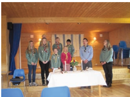
Speiderne stiller trofast opp på Valatun.