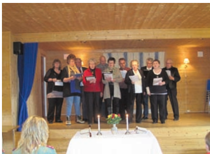
Valatun sanglag synger ved kirkekaffen.