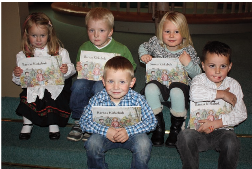
Utdeling av 4-årsbok i Østsinni kirke 23. oktober

Normisjon, Postboks 7153, St. Olavs plass, 0130 OSLO, kontonummer 1503.02.13537, merk giroen med fam Sandens arbeid eller prosjektnr. 115.70.454