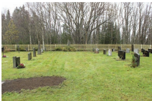
Nytt og fint gjerde ved Åsli kirkegård

De fleste av disse tiltakene dekkes ved hjelp av midler bevilget til tiltak i kommunens vedlikeholdsplan, da vedlikehold som gjelder kirker også har kommet med i denne planen. Det er positivt!