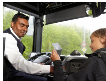
Før 2. oktober, vis reisekortet til sjåføren

Kortleseren kontrollerer at eleven reiser i gyldig sone og i gyldig tidsrom. Når alt er i orden, bekreftes dette med et lydsignal og grønt lys. Hvis reisekortet ikke godkjennes, vil kortleseren gi tre korte lydsignaler og vise rødt lys. Be sjåføren om hjelp hvis kortet ikke virker som det skal.