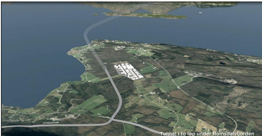
Tunnel i to løp under Romsdalsfjorden