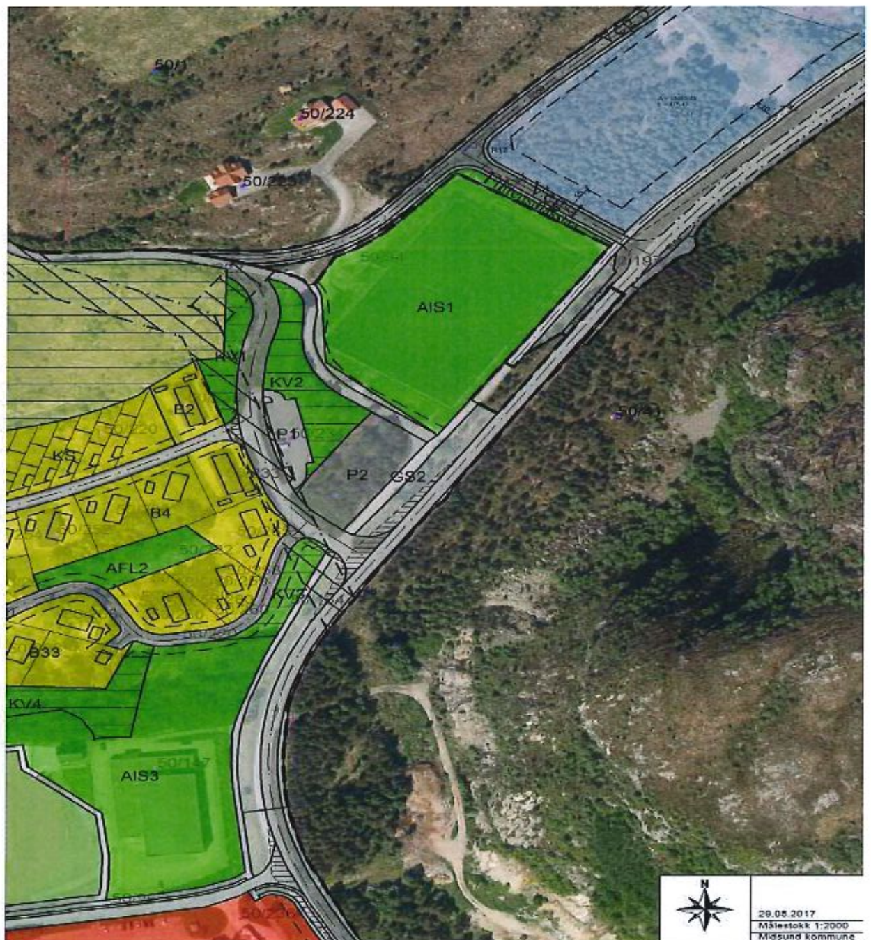
Kart over området.