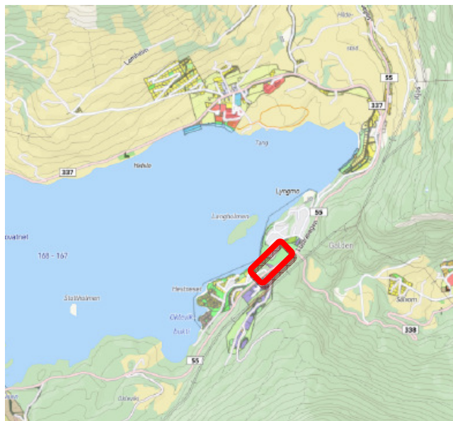
Kart 1: Oversiktskart

Eier av Lustraporten har kontaktet Utmarksplan AS for å få utarbeidet detaljreguleringsplan for et område Lustraporten eier, samt en del av naboområdet. Her er kommunen grunneier, men Lustraporten er i forhandlinger med kommunen om kjøp av areal.