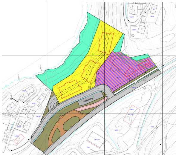
Kart 2: Skisse til foreløpig planforslag.