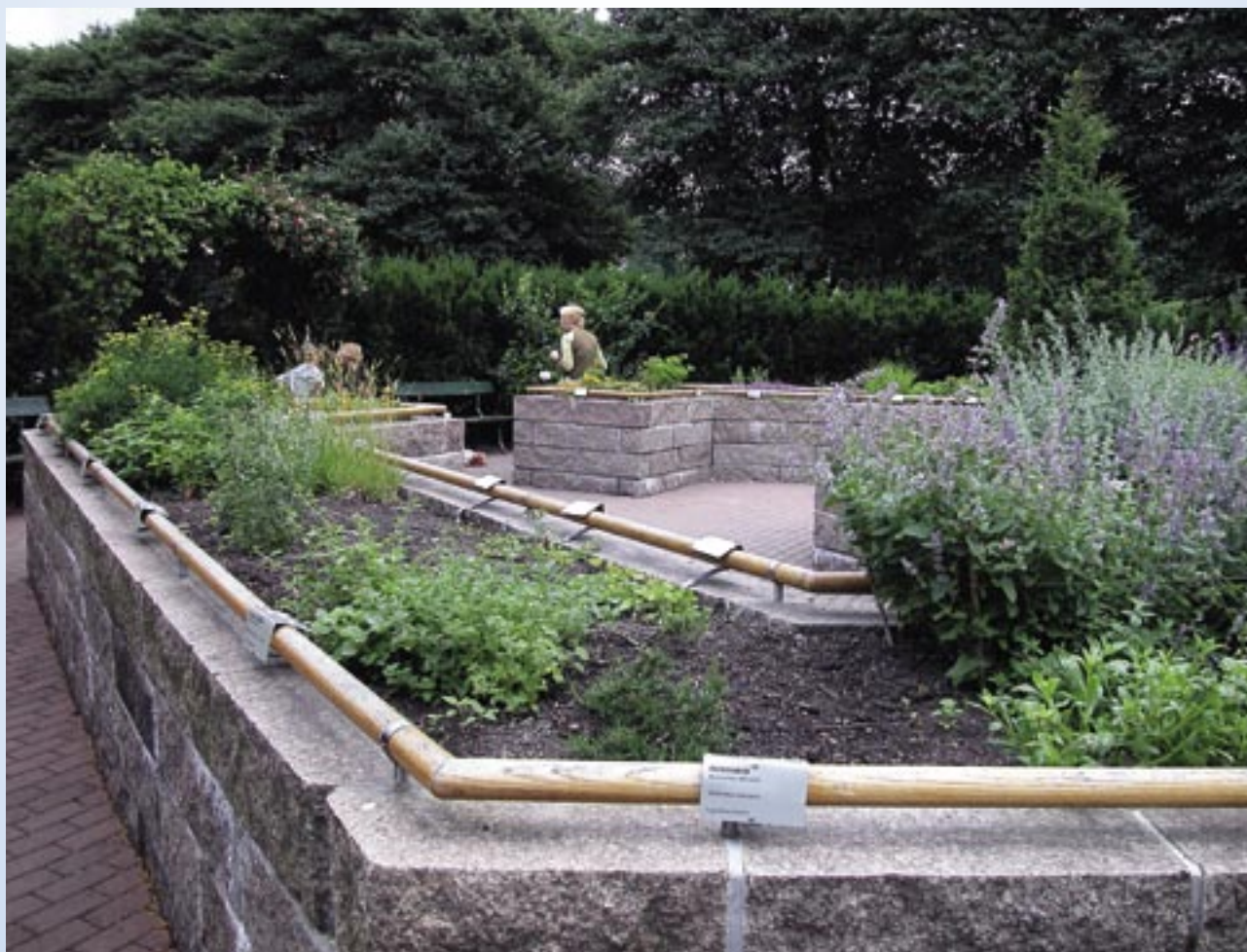
Duftehagen i Oslo

Blinde og svaksynte, døve og mennesker med nedsatt hørsel. Mennesker med redusert orienteringsevne og med ulike lese- og skrivevansker.