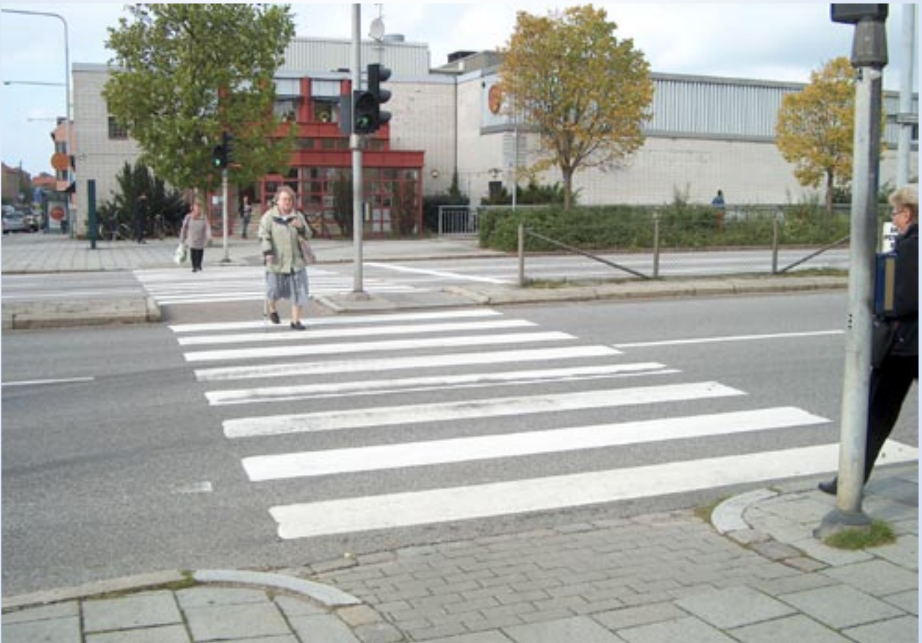
Todelt gang for rullestolbruker og synshemmet