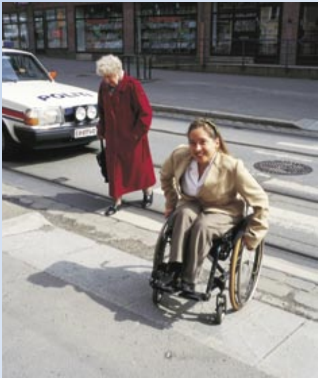
Bratt nedsenk på grunn av korte granittsteiner og høye fortau reduserer framkommeligheten.