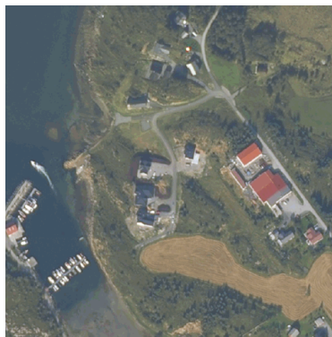
Bilde: Røberg bustadfelt.