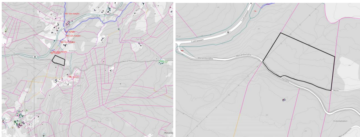
Kart 1: oversiktskart

Planinitiativet vart handsama i Plan- og forvaltningsutvalet den 13.11.22, der dei tilrådde at rådmannen kunne gå vidare med saka som planinitiativ. Oppstartsmøte vart gjennomført den 17.11.22. Etter dialog med kommunen, vart planinitiativet revidert til å gjelde tre tomtar samt tilhøyrande trafikkareal og skråningar, for å få ein heilskapleg plan på området. Planinitiativet er ein enkel forklaring på kva initiativtakar/grunneigar tenkjer å leggja til rette for i området.