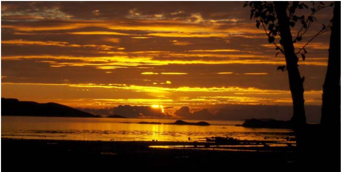
Himmel og hav i ett på Tranås