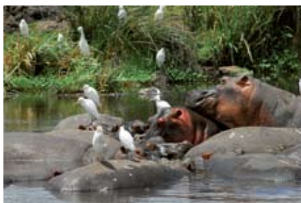
BADELAND: Siesta ved elvebredden.