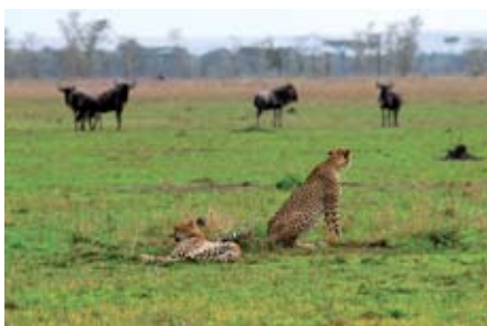
METT OG GOD: Mette geparder er fredelege dyr