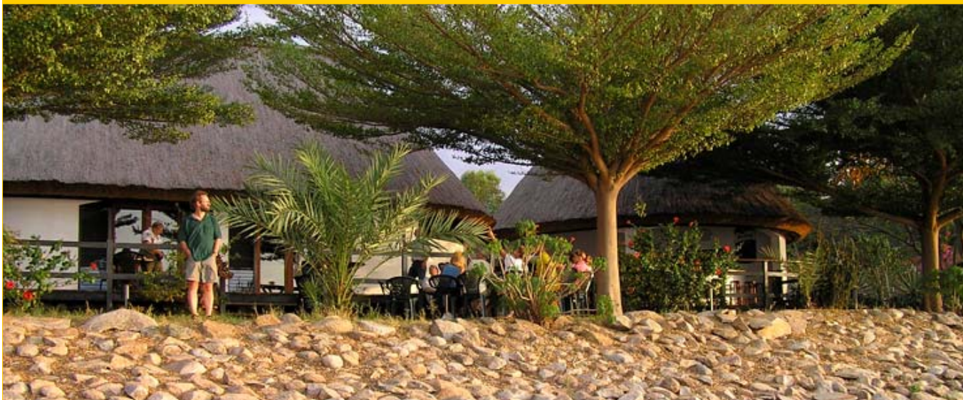
Bildet: Speke Bay Lodge ligger ved den enorme Victoriasjøen. Her kan du nyte solnedgangen i vest, et godt måltid og god drikk i restauranten. Neste morgen blir vi rodd til en fargerik landsby i nærheten.

Dag 8: Etter frokost ute på restaurantens terrasse like ovenfor strandkanten er det å kjøre sydøst mot Serengeti National Park. Vi har god tid til å stoppe og se på alle de spennende dyr som lever her, slik som løver, geparder, elefanter, sjiraffer, gnuer, bøfler, sebraer, flere arter hjortedyr, aper, øgler, flodhester, krokodiller og mange slags fugler - store og små. Du er garantert å se alle disse dyrene - opptil flere ganger i løpet av den tiden du oppholder oss på Serengeti! Du kjører til Seronera Wildlife Lodge ( bildet under ) som ligger midt ute på Serengeti. Dette er et helt spesielt hotell med arkitektur tilpasset noen enorme steiner i slettelandskapet. Her spiser du en kjempegod afrikansk middag fra et bugnende buffébord. Her kan du oppleve at villdyrene, både løver og elefanter og hyener slår seg til inntil hotellveggen. Apekattene føler seg svært så hjemme, og viser gjerne opp sine streker like utenfor restaurantvinduet.