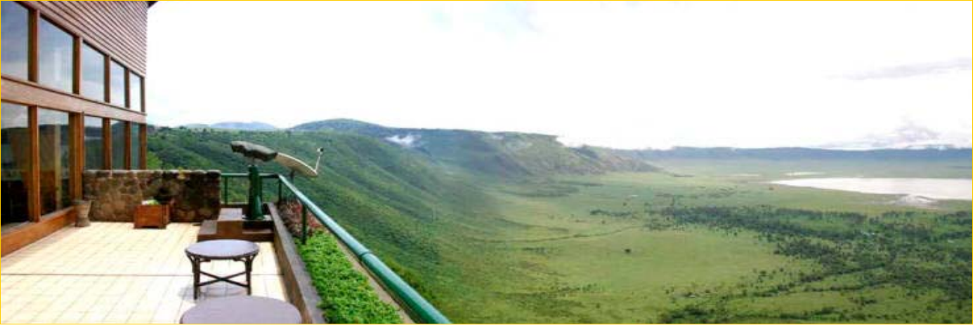
Bildet: Ngorongoro Wildlife Lodge - legg merke til utsikten over krateret, et enormt hull i bakken etter tidligere tiders vulkan. Rommene, restauranten, lobbyen, baren og terrassen har denne utsikten.

Dag 11. Vi kjører ned kraterkanten til bunnen av krateret. Hele dagen farter vi rundt og ser på dyr, fotograferer, filmer og nyter opplevelsene. Det utvikler seg lett til en spøkefull konkurranse om hvem som får øye på de sjeldne dyrene først, slik som hyener, geparder, løver, nesehorn... Det er nesten ikke til å tro at det er mulig å tilbringe en hel dag i bunnen av et vulkankrater, men det er faktisk det! Her er det ville dyr i alle retninger. Når det nærmer seg kvelden er vi fulle av inntrykk, og bilen begynner "klatringen" opp kraterveggen på en smal, humpete vei. Før solnedgang kommer vi opp til Ngorongoro Wildlife Lodge for å spise en god buffémiddag, nyte utsikten når mørket nærmer seg og igjen sove på kanten av et vulkankrater.