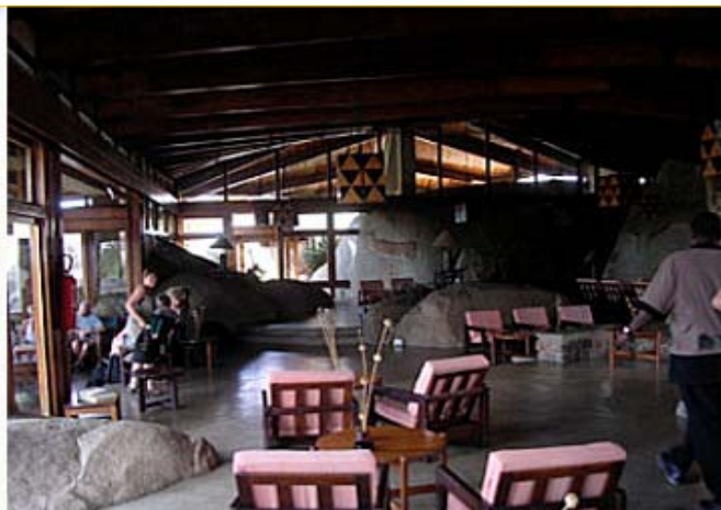
Bildene: Seronera Wildlife Lodge ligger midt ute på Serengeti. Dette er et spesielt hotell designet etter naturen, og bygget mellom kjempestore steiner som er høyere enn hotellet. Blant annet fra restauranten og baren er det utsikt over de langstrakte slettene som Serengeti er.