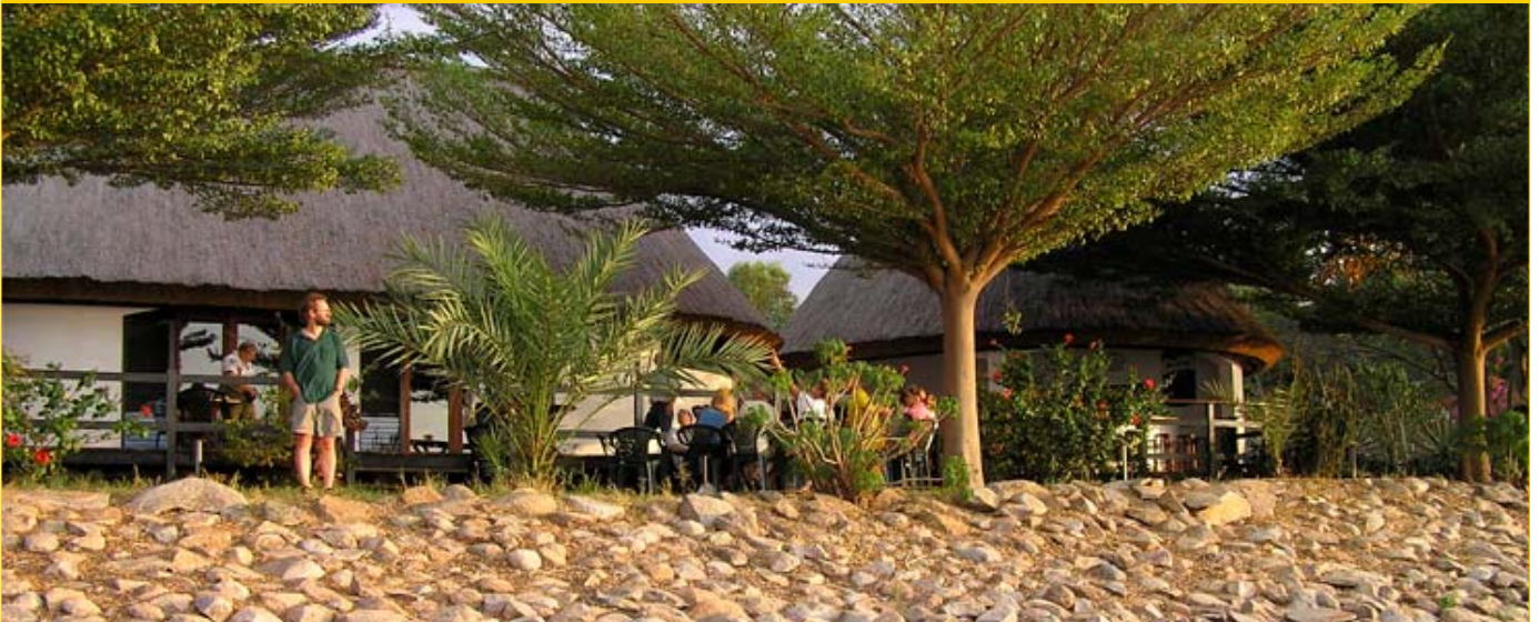
Bildet: Speke Bay Lodge ligger ved den enorme Victoriasjøen. Her kan du nyte solnedgangen i vest, et godt måltid og god drikk i restauranten. Neste morgen blir vi rodd til en fargerik landsby i nærheten.

Dag 8: Etter frokost ute på restaurantens terrasse like ovenfor strandkanten er det å kjøre sydøst mot Serengeti National Park. Vi har god tid til å stoppe og se på alle de spennende dyr som lever her, slik som løver, geparder, elefanter, sjiraffer, gnuer, bøfler, sebraer, flere arter hjortedyr, aper, øgler, flodhester, krokodiller og mange slags fugler - store og små. Du er garantert å se alle disse dyrene - opptil flere ganger i løpet av den tiden du oppholder oss på Serengeti! Du kjører til Seronera Wildlife Lodge ( bildet under ) som ligger midt ute på Serengeti. Dette er et helt spesielt hotell med arkitektur tilpasset noen enorme steiner i slettelandskapet. Her spiser du en kjempegod afrikansk middag fra et bugnende buffébord. Her kan du oppleve at villdyrene, både løver og elefanter og hyener slår seg til inntil hotellveggen. Apekattene føler seg svært så hjemme, og viser gjerne opp sine streker like utenfor restaurantvinduet.