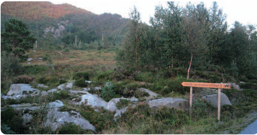
Frå starten på løypa i Sollibotn.