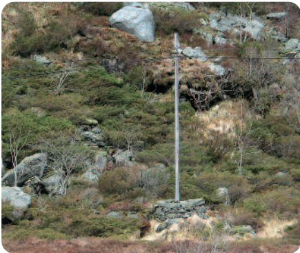
Telefonstolpe på kunstferdig bygd fundament.

Tek du av frå hovudvegen og går turstien inn til Eivindvik vil du passere gamle televerkssminne bygde i 1910, med kunstferdig bygde fundament for telefonstolpar. Dette vart reist av "graffarane" - anleggsfolk som bygde telegraf- og telefonliner rundt om i landet. Frå Gulen kom eit hundretals telegrafarbeidarar. Inga bygdelag i Noreg hadde så mange graffarar som Gulen. I 1905 reiste jamvel mange graffarar frå Gulen til Island for å bygge den første telefonlina frå Seydisfjord til Reykjavik.