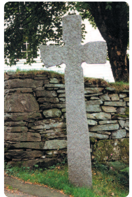
Den over 1000 år gamle keltiske krossen ved kyrkjegardsmuren i Eivindvik.

Gulatinget var ei årlig tingsamling der bønder frå heile kysten møttes i Gulen for å drøfte saker som skattlegging, veg- og kyrkjebygging, militære plikter og ei rad andre spørsmål. I tillegg brukte tinget å dømme i tvistemål og kriminalsaker. Når tinget samla seg i Gulen første gongen veit vi ikkje, men det var i alle høve etablert på 900-talet.