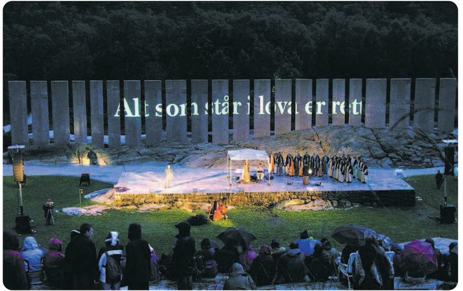
På Flolid er Sogn og Fjordane sin Tusenårsstad, Gulatinget. Anlegget vart opna for publikum i august 2005 og biletet frå denne markeringa.

Dei tusen år gamle steinkrossane i Eivindvik står på kvar side av plassen der ein meiner at Gulatinget