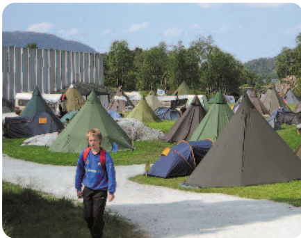
Tusenårstaden som kulturell møteplass.

På kaia i Eivindvik kan du leige sykkel og sykle vidare til Flolid og Tusenårstaden Gulatinget, eller du kan gå