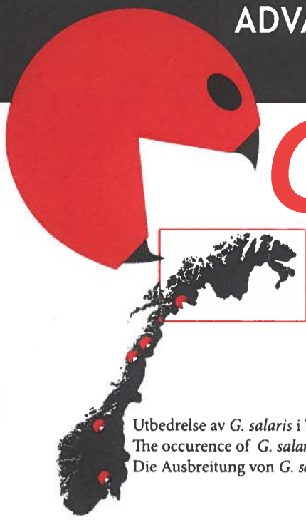
Utbedrelse av G. salaris i Troms og Finnmark The occurrence of G. salaris in Troms and Finnmark Die Ausbreitung von G. salaris in Troms und Finnmark