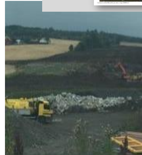
Bilde fra «bakkeplanering» som har blitt deponi på et jorde i Akershus uten gyldig tillatelse