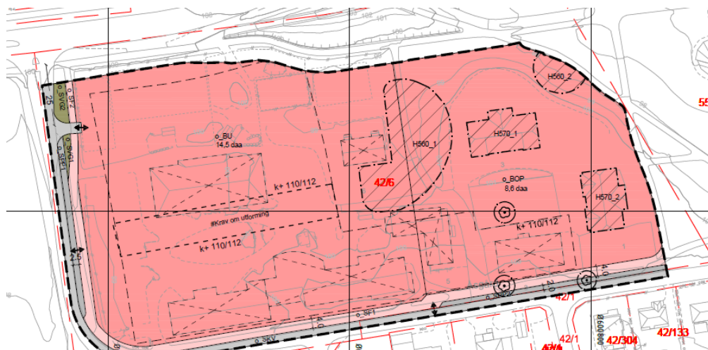
Forslag til reguleringsplan for Åsgård skole, alternativ 2