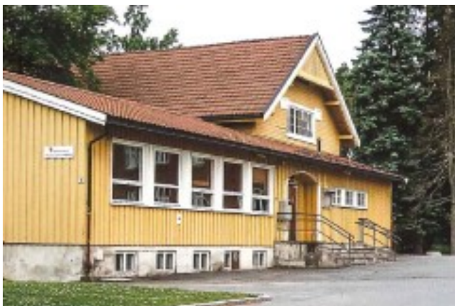
Midtgard – den tidligere gymsalen med lavt sløydsal-påbygg

Anbefaling: Det anbefales at Midtgard delvis bevares. Da vil noe av skolehistoriens bygningsmasse stå igjen og gi stedet identitet og særpreg. Siden paviljong 4 og 5 er bestemt revet vil det gi større/bedre uteareal for elevene ved at ny bygningsmasse blir mer effektiv/høyere. D6 bør flyttes/rives for å få en god og helhetlig løsning for et nytt skolebygg. Det gule huset kan rives.