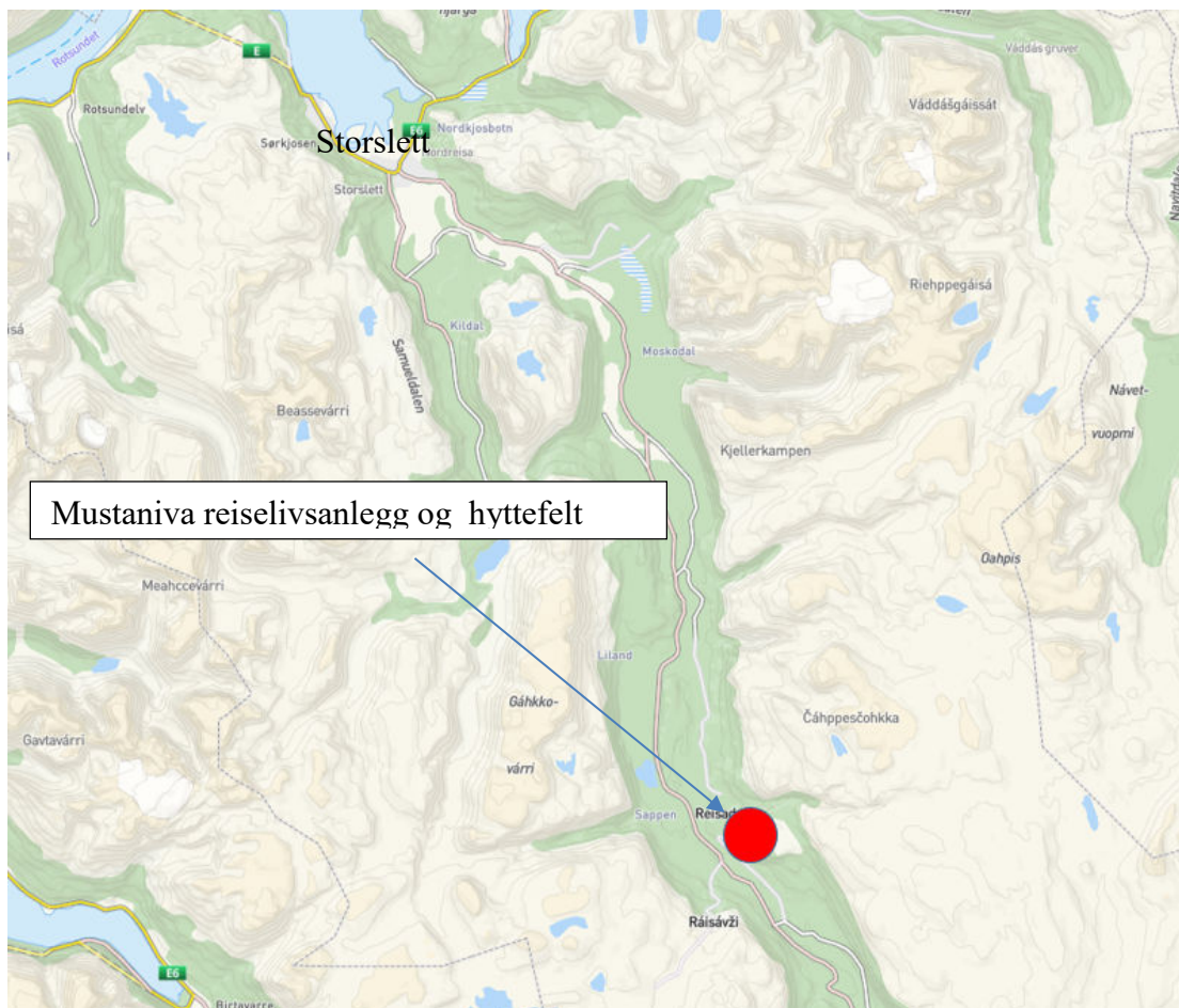
Figur 1 Kartutsnitt Mustaniva reiselivsanlegg og hyttefelt i Reisadalen

I henhold til Plan- bygningslovens §12-8, varsles det her oppstart av planarbeid vedr. reguleringsplanen for Mustaniva reiselivsanlegg og hyttefelt på eiendommen gbnr. 29/21 i Nordreisa kommune.