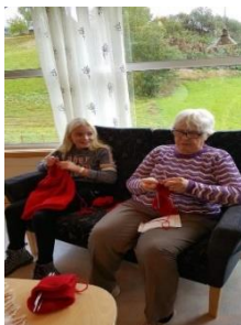
Aldersblanding «Glede andre»

Mellomtrinnet har i over 10 år jobba aldersblanda ein gong i veka. Då jobbar dei tverrfagleg og nyttar høvet til å kople dei praktisk-estetiske faga saman med basisfag og digitale ferdigheiter.