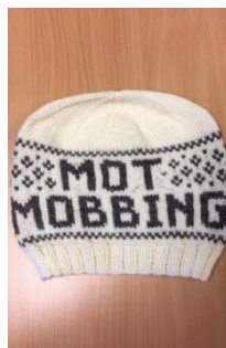
Alle tilsette har luer