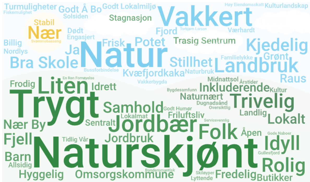
Ordsky fra spørreundersøkelse

På dette spørsmålet har vi laget en ordsky for å vise hva som går igjen. De ordene som er størst i ordskyen er de ordenen som har blitt mest gjengitt.