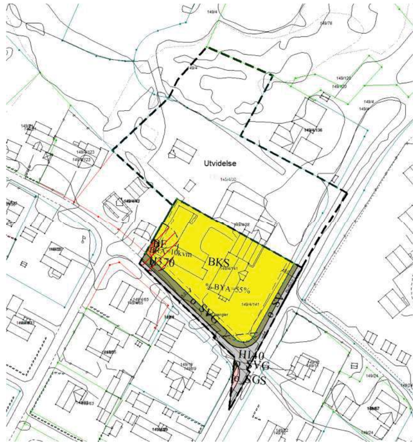
Figur 2 Gjeldene plan og utvidelse

Det skal også reguleres inn en snarvei (gangvei) langs planavgrensningen i vest mellom Tronstadveien og dagligvarebutikken og cafeen nord for planområdet. Dette gjøres etter avtale med oppdragsgiver og Hemnes kommune. Det skal også reguleres inn en gangvei nord for Tronstadveien innenfor planforslaget. Denne «kobler seg på» eksisterende gang- og sykkelvei sørover langs Nergårdsgata.