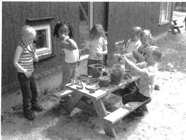
Bilete: Hægebostad barnehage

I plan- og bygningslova § 11-1 går det fram at kommunen skal ha ein samla kommuneplan som omfattar arealdel og samfunnsdel med handlingsdel.