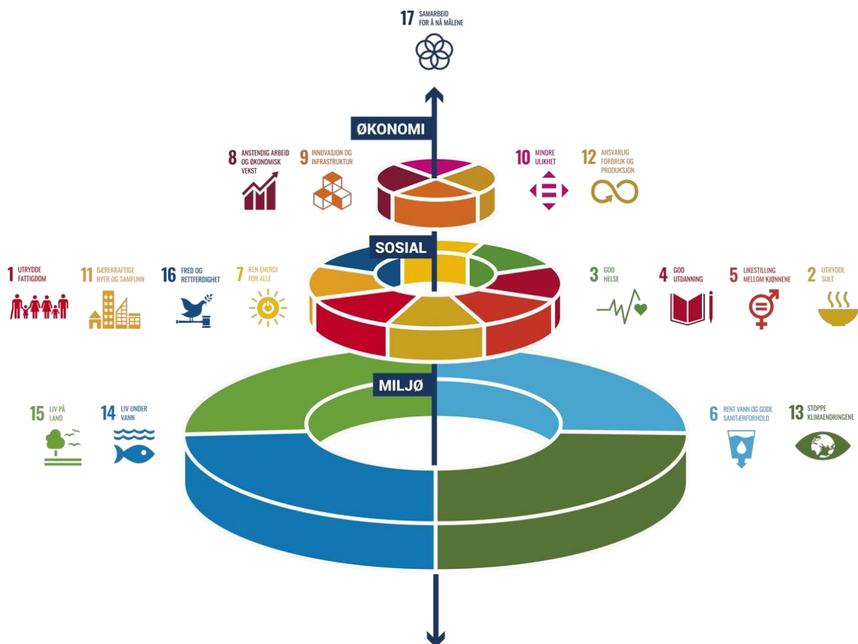
Figur 3: De tre dimensjonene/kategoriene av bærekraftmålene. Kilde: Forskningsrådet.