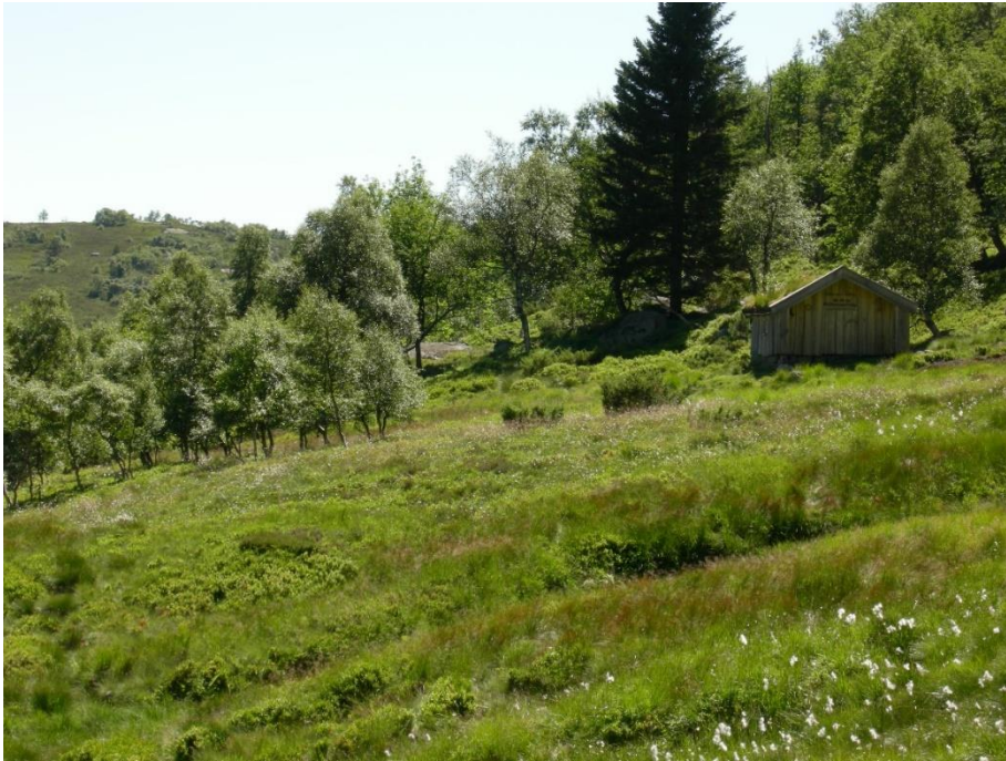
Bilde frå Bryggesåhommen – gammel slåttemark med biologisk mangfald – foto; Odd Arve Kvinnesland