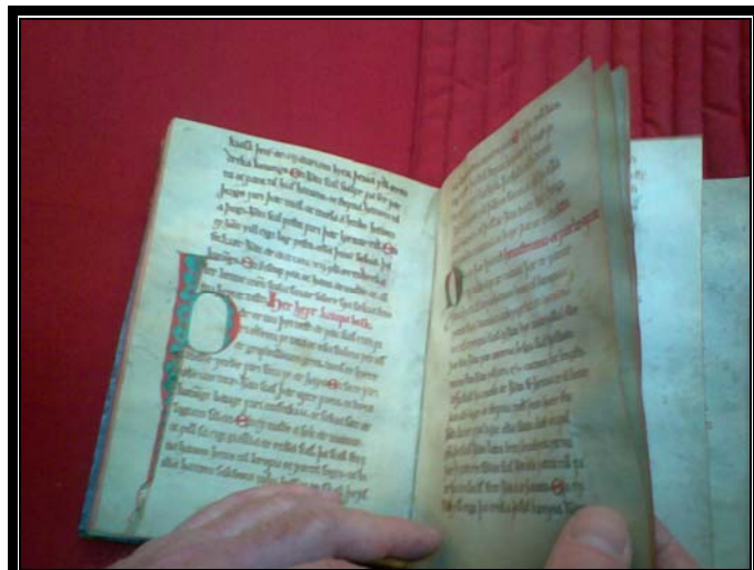
Rantzauboka – originalutgåva av Gulatingslova.